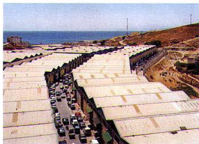
„Grossraum“, 2004/2005, 35-mm-Filmtriptychon, Farbe, stumm, 35 min