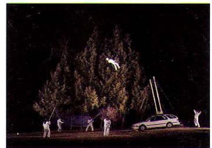
„No. 14“, 2006, digitaler C-Print, 90 x 125 cm, Edition 5

Die steril-weiße Kleidung sagt: Stammzellenforschung, der Motorradhelm auf dem Kopf signalisiert Lebensgefahr. Doch die Männer, die in William Lamsons „Sublunar“-Serie in ihren Ganzkörperoveralls in der Dunkelheit stehen, forschen nicht an einer seltenen Desoxyribonukleinsäure-Kombination, sondern an der Realisierung des spek-